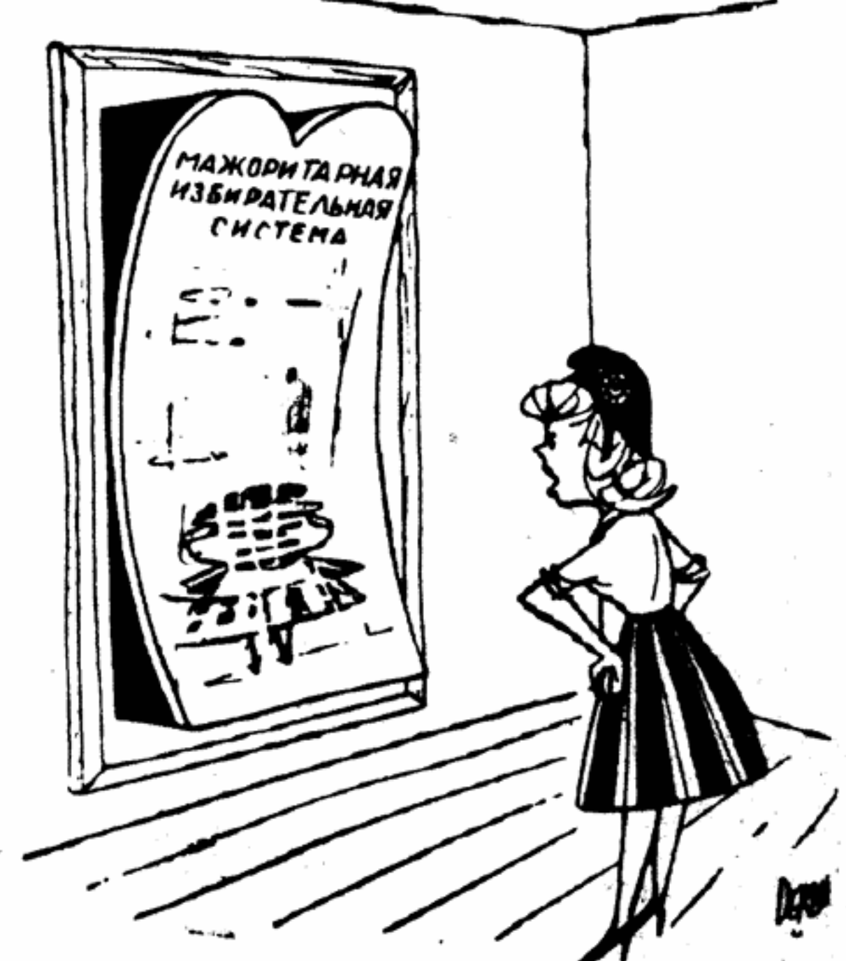
Марианна: — Неужели это и? Рис. худ. Делана из французского еженедельника «Франс нуэвель».

ВОЙНА ИЛИ МИР? До референдума по вопросу о новой конституции избирателям обещали полные «обновление» страны. В чем же выражается это «обновление»? Известно, что IV Республика задохнулась прежде всего из-за жестокого финансового кризиса, вызванного непомерными военными расходами. И вот в начале ноября печать сообщает, что эти расходы неизбежно возрастут. По бюджету на 1959 год они увеличатся до астрономической суммы в 1 590 миллиардов франков против 1 326 миллиардов в нынешнем году.